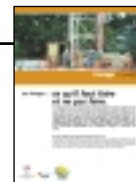
Plaquette Forage : ce qu'il faut faire et ne pas faire à télécharger sur le site de la DIREN Aquitaine.