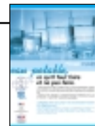
Plaquette Eau potable : ce qu'il faut faire et ne pas faire à télécharger sur le site de la DIREN Aquitaine.